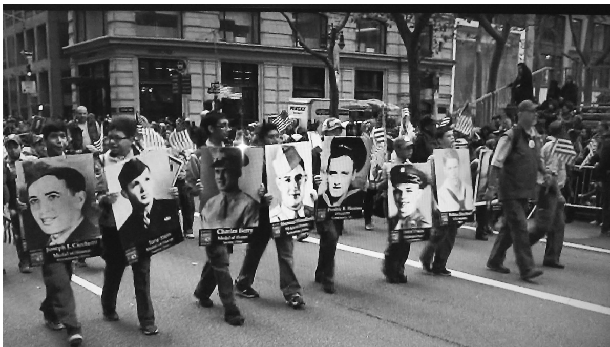
St. Mary Gate of Heaven Troop Boy Scout Troop 173 honors our veterans as they march down 5th Avenue in the Veterans Day Parade.